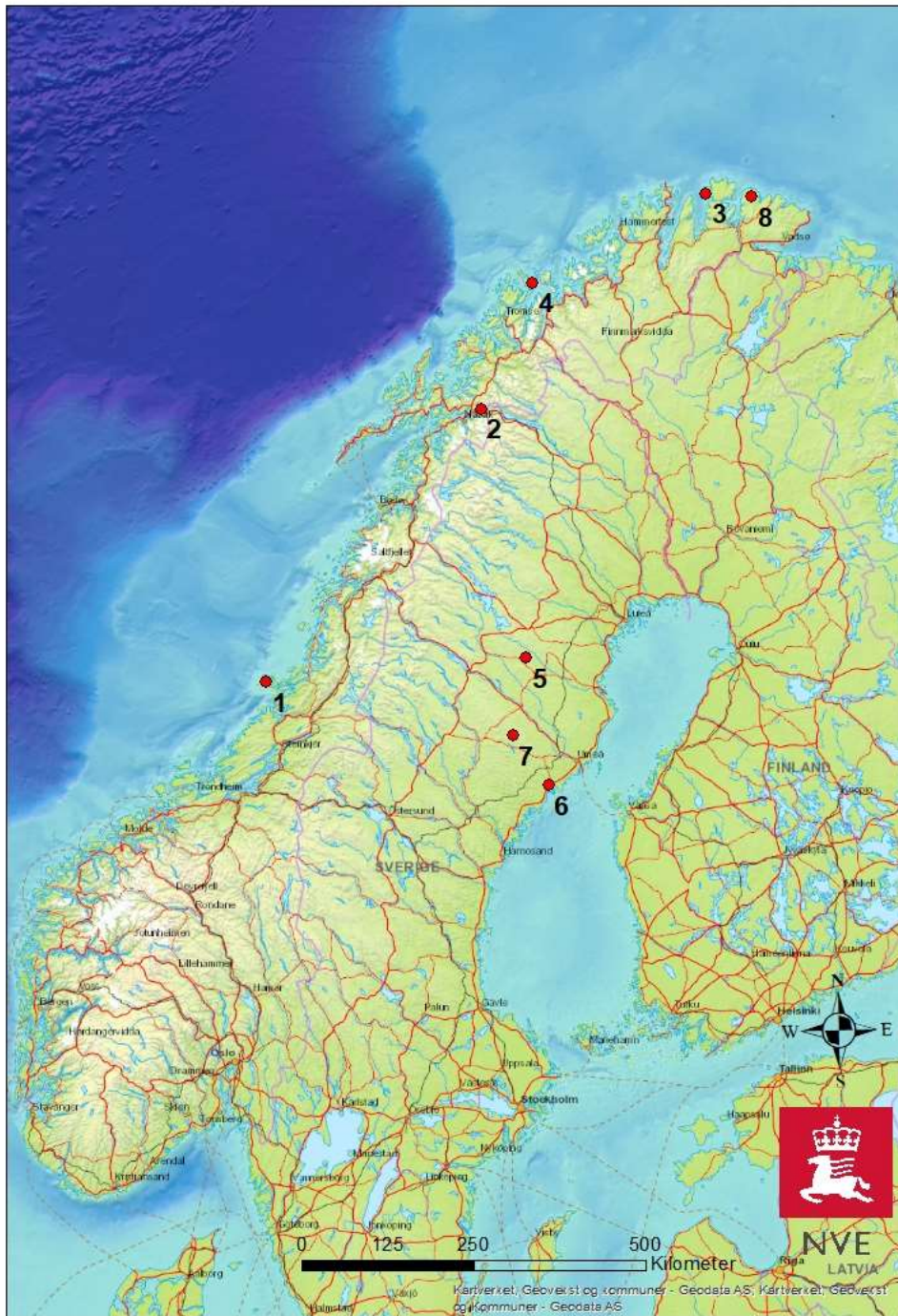
Figur 2 Geografisk plassering over de enkelte studiene på effekter av vindkraft på tamrein som er gjengitt i denne rapporten. 1. Vikna vindkraftverk. 2. Nygårdsfjellet vindkraftverk. 3. Kjøllefjord vindkraftverk. 4. Fakken vindkraftverk, 5. Storliden og Jokkmokksliden vindkraftverk, 6. Gabrielsberget vindkraftverk, 7. Stor-Rotliden vindkraftverk, 8. Rákkočearro vindkraftverk.