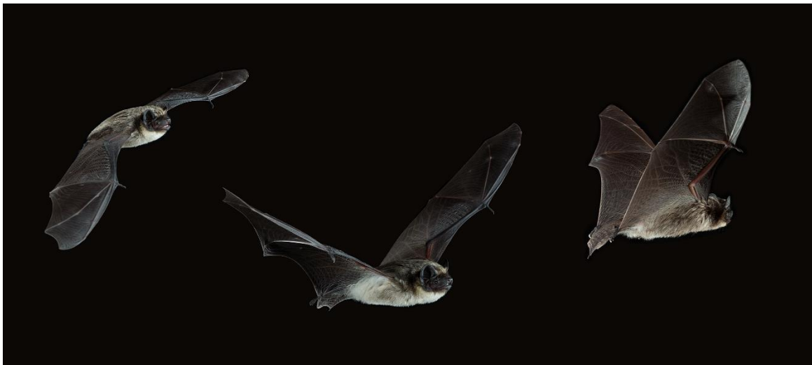
Vespertilio murinus/Skimmelflaggermus.