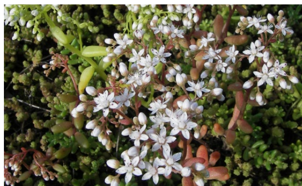
Foto 1. Hvitbergknapp. Sedum er vakre tørketålende planter.

Semi-intensiv tak kommer i en mellomstilling. Tykkelsen på vekstmediet er ofte 10-20 cm, og arts-mangfoldet er større enn på ekstensive tak. Torvtak tilhører denne gruppen.