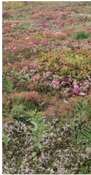
Sedumtak på Norsk gjenvinning på Haraldrud Oslo. Det gule er tatt i juni og det rosa-rød i august.