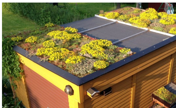
Foto 2. Forsøksfelt med sammenligning av tak med, eller uten vegetasjon i Oslo. GT1 til venstre.

Foto 3. To eksempler på oppbygging av ekstensive sedumtak: ca 3 cm sedummatte med substrat av knust murstein og lignende, iblandet litt kompost. Under enten dreneplatt av gjennomhullet "knasteplast", eller 1 cm filtmatte. GT 1 og GT2 i tabell 1.