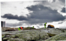
VÆRFORBEHOLO. De kroatiske masterbyggerne i Hardanger får bare betalt når været er såpass bra at de kan flys inn til anleggsområdet med helikopter.

Et vesentlig prinsipp er at Statnett skal sikre høy forretningsetisk standard i all skattebehandling og sørge for likebehandling av leverandørene.