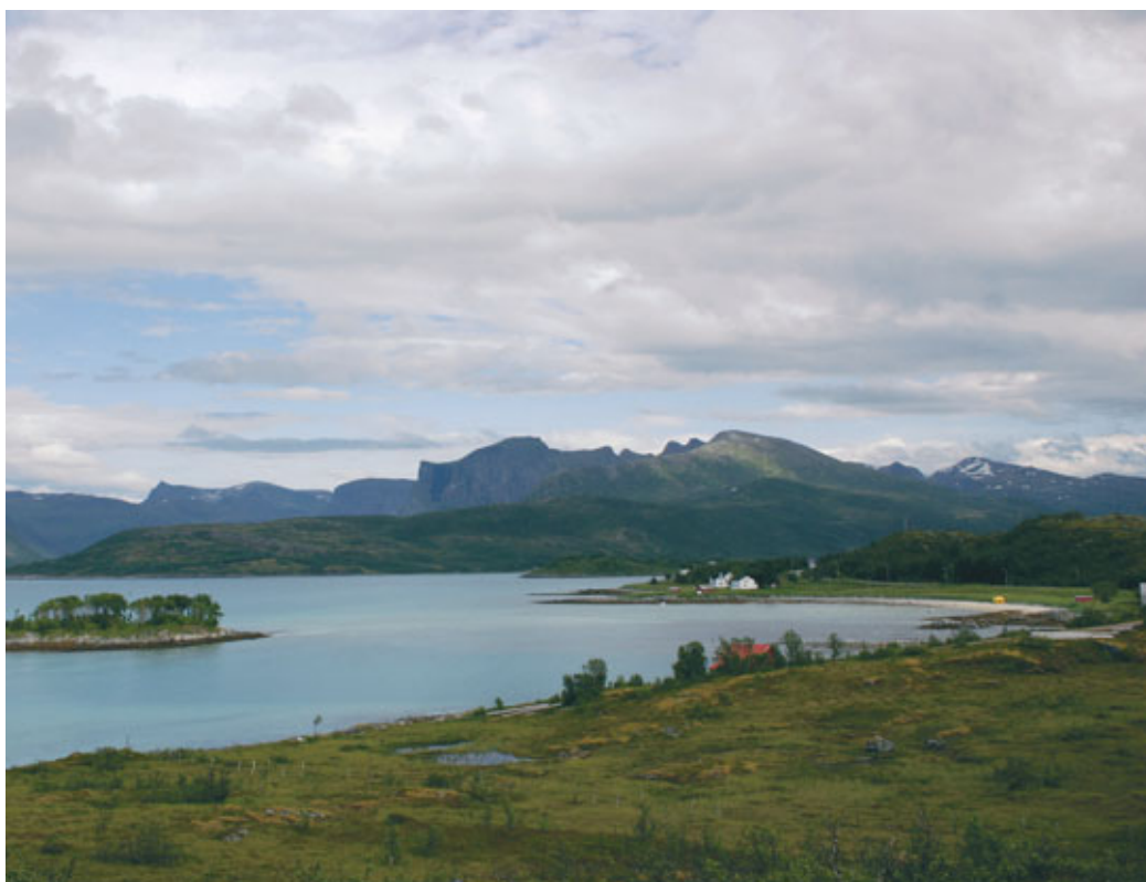
Flatneset på Senja, den lange ryggen midt på bildet, får kanskje vindmøller. Området er også reinbeiteland.

Det er i nyere vindkraftkonsesjoner satt vilkår som er direkte knyttet opp til reindrifta. Dette gjelder blant annet vilkår om at det skal tas hensyn til reindriftas bruk av området under anleggsarbeidet og under driften av anlegget. Det er for eksempel satt vilkår om at aktivitet knyttet til vindkraftverk skal begrenses under kalvingstida. Det er i noen konsesjoner også satt vilkår om at bruk av anleggsvegen skal fastsettes i samråd med reindriftsnæringen.