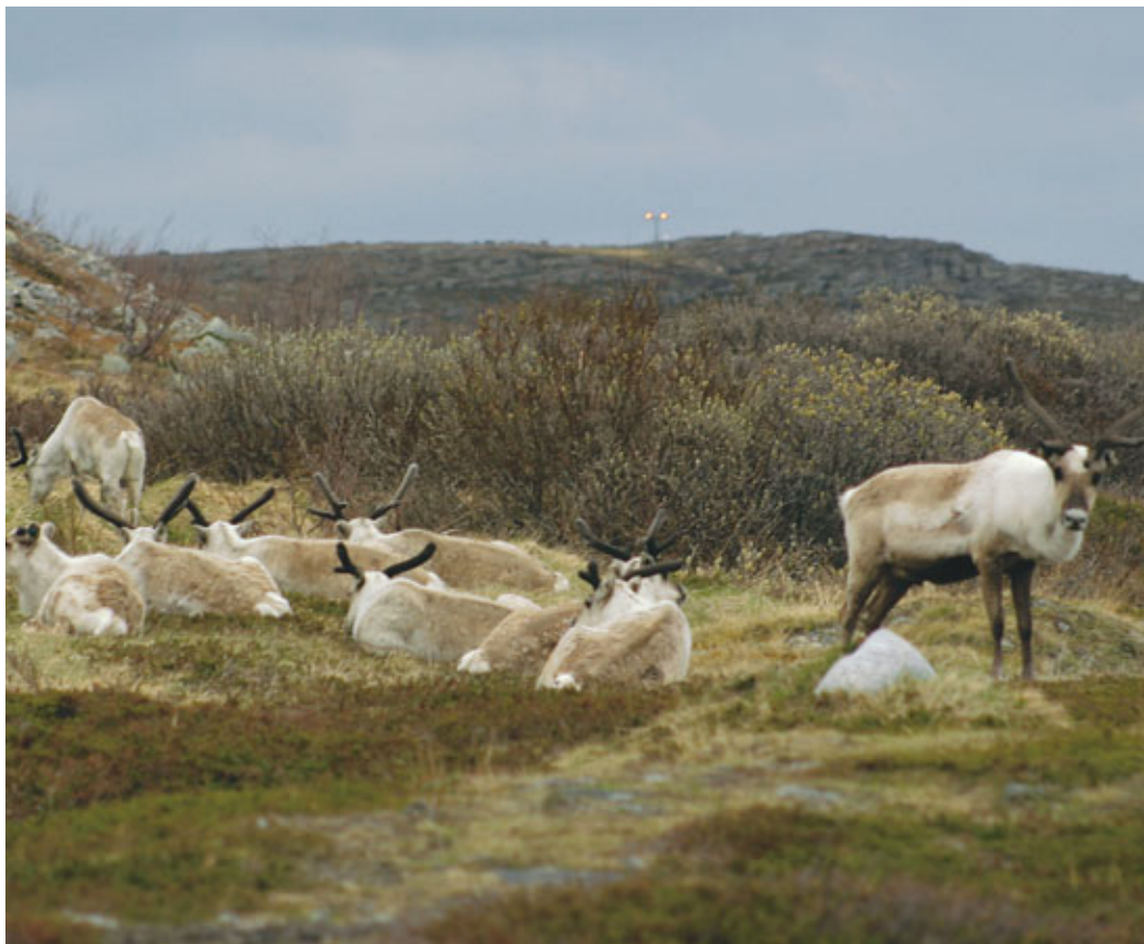
Reinflokken er gått til ro i betryggende avstand fra flyplassen i Vadsø.