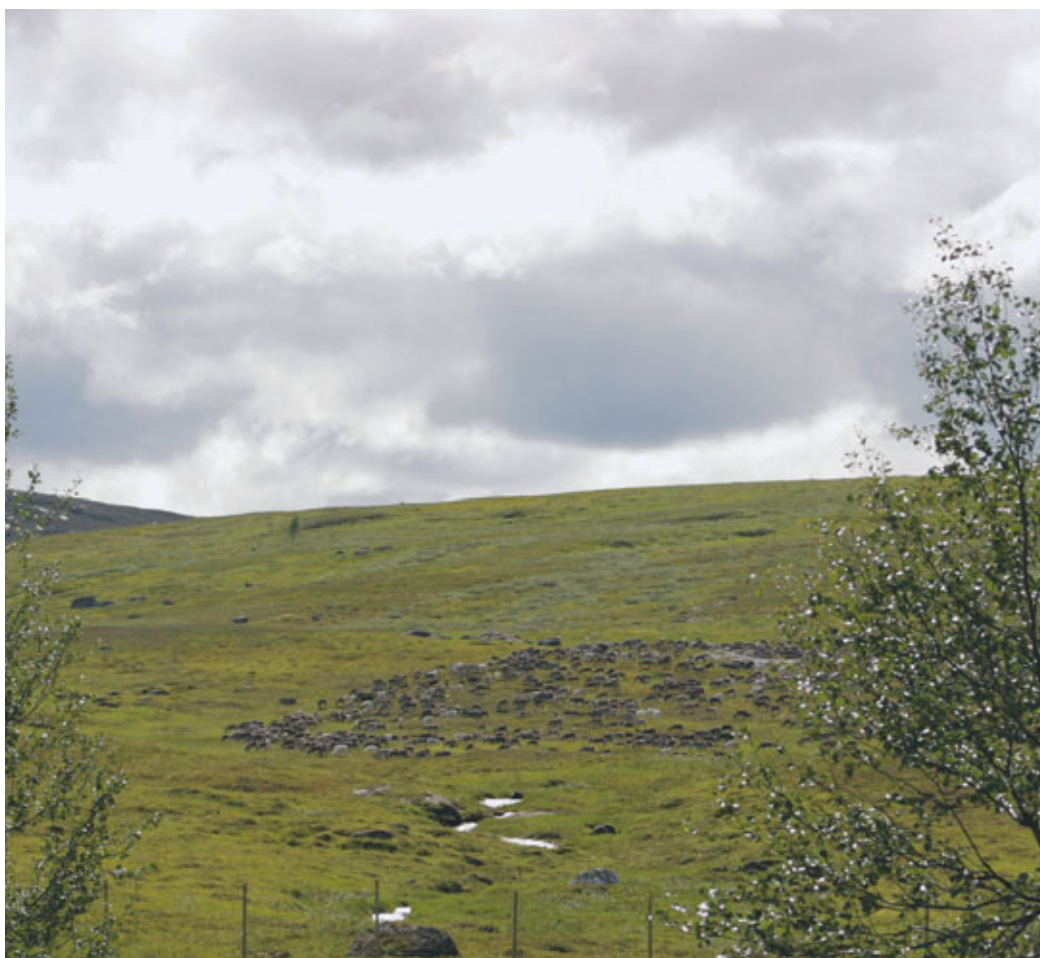
Reinflokk på saftig sommerbeite.

For å regulere vannføringen over året og i tråd med behovet til enhver tid, lagres vann i reguleringsmagasin. Vassdragsreguleringsloven kommer inn der et tiltak innebærer regulering av vassdragets naturlige vannføring, for eksempel gjennom bygging av dam