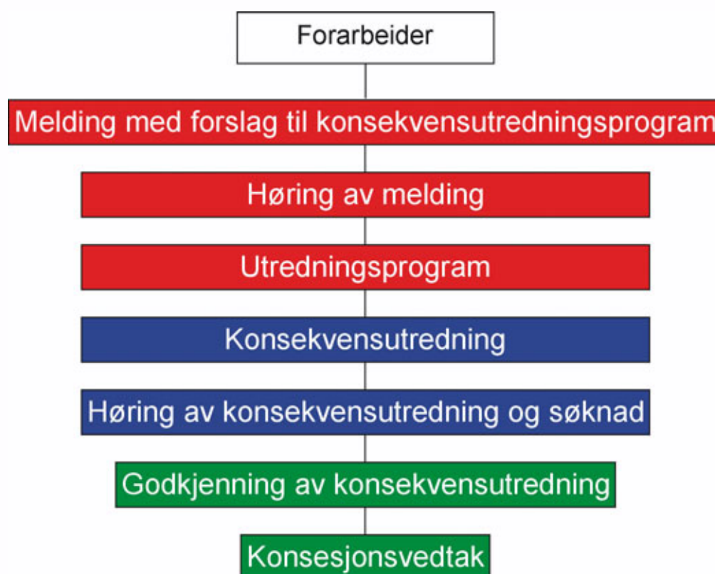
Fig. 3 Oversikt over behandlingsprosessen i vindkraftsaker.

NVE og Reindrifftsforvaltningen foreslår derfor følgende tiltak og presiseringer knyttet til NVEs saksbehandling og tiltakshaveres arbeid med meldinger og søknader/konsekvensutredninger.