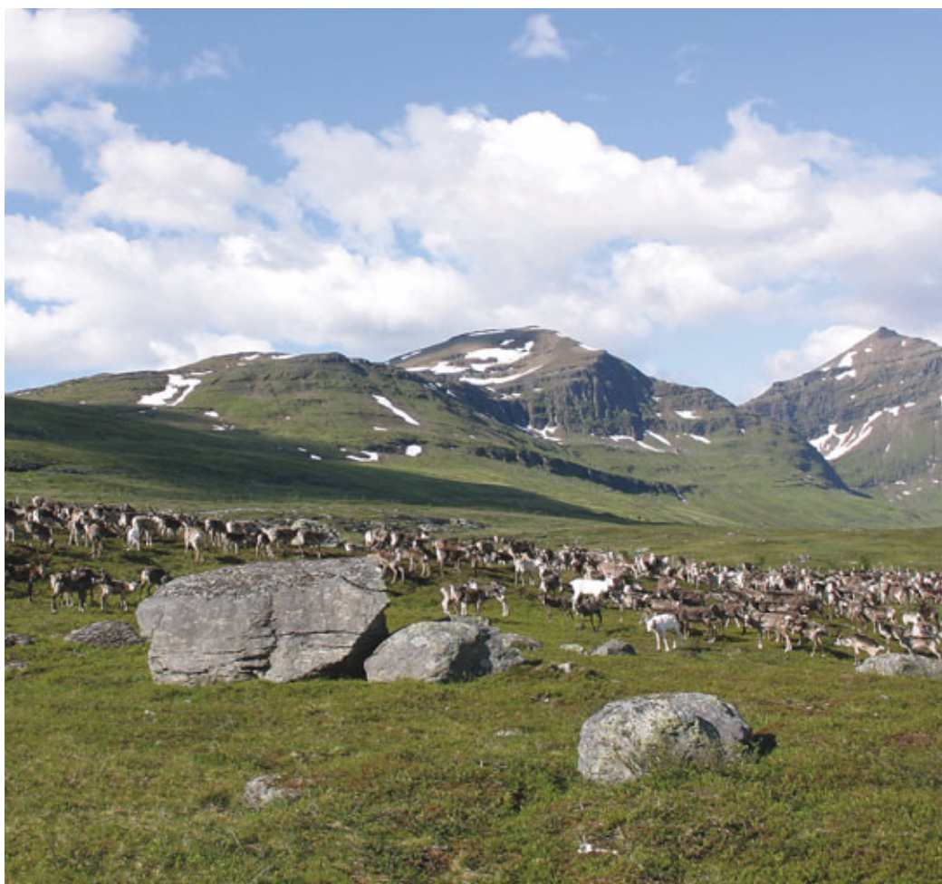
Reinflokk samlet til merking i Hjerttind Reinbeitedistrikt i Troms.