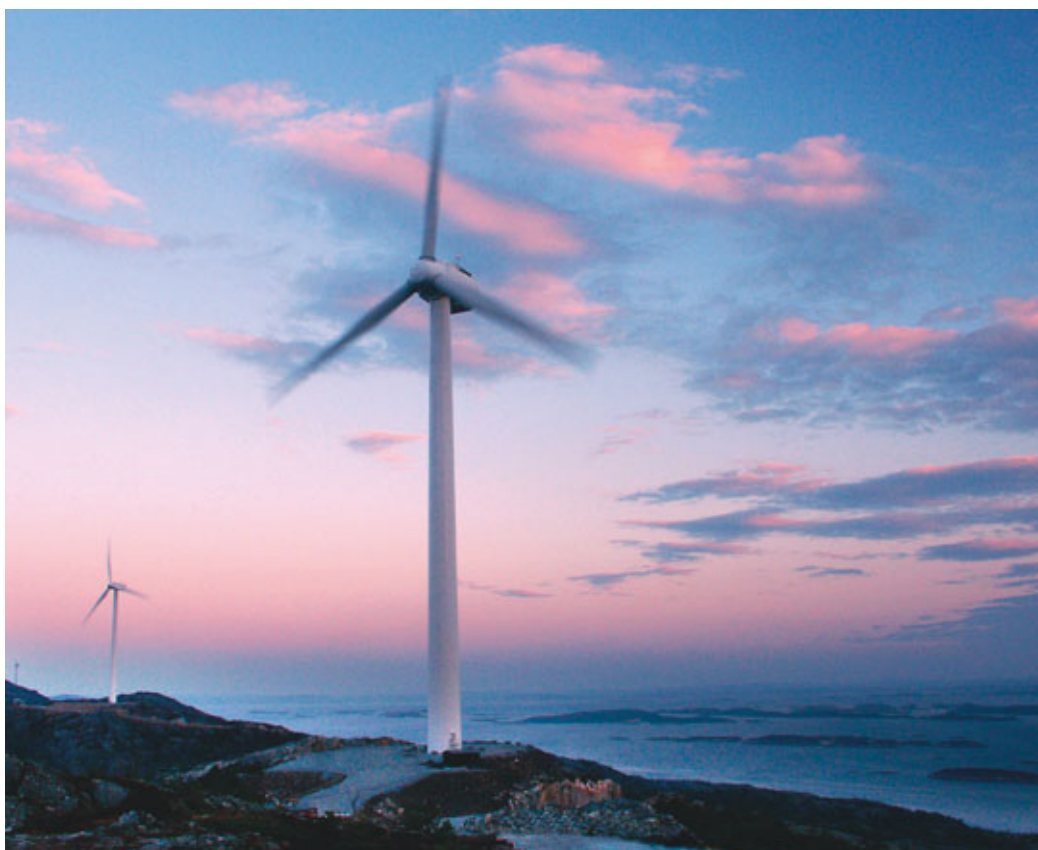
3 MVH og 1,65 MVH vindturbiner på Hundhammerfjellet i Nærøy.

Eventuelle nye nettforsterkninger i sentralnettet vil bli underlagt samme omfattende behandlings- og utredningsprosess (konsesjonsbehandling og konsekvensutredning) som de planlagte vindkraftverkene. En eventuell ny forsterkning som vil kunne ta imot vindkraft utover 150–200 MW vil tidligst kunne være klar i 2010–2012.