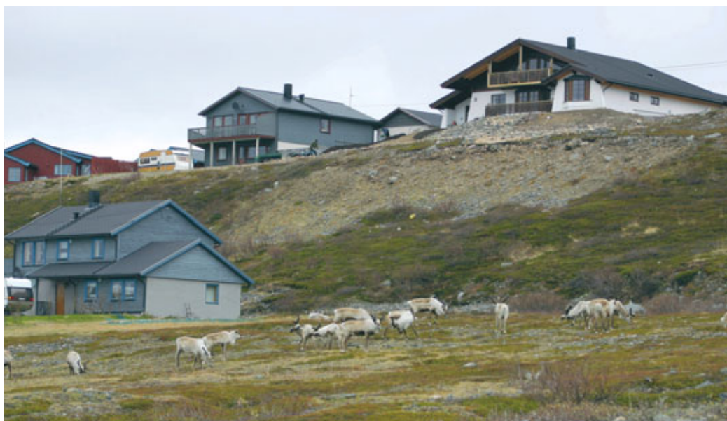
I våknipa kan okser og fjorårskalver ofte observeres nær trafikkerte og utbygde områder. Beite prioriteres framfor ro.