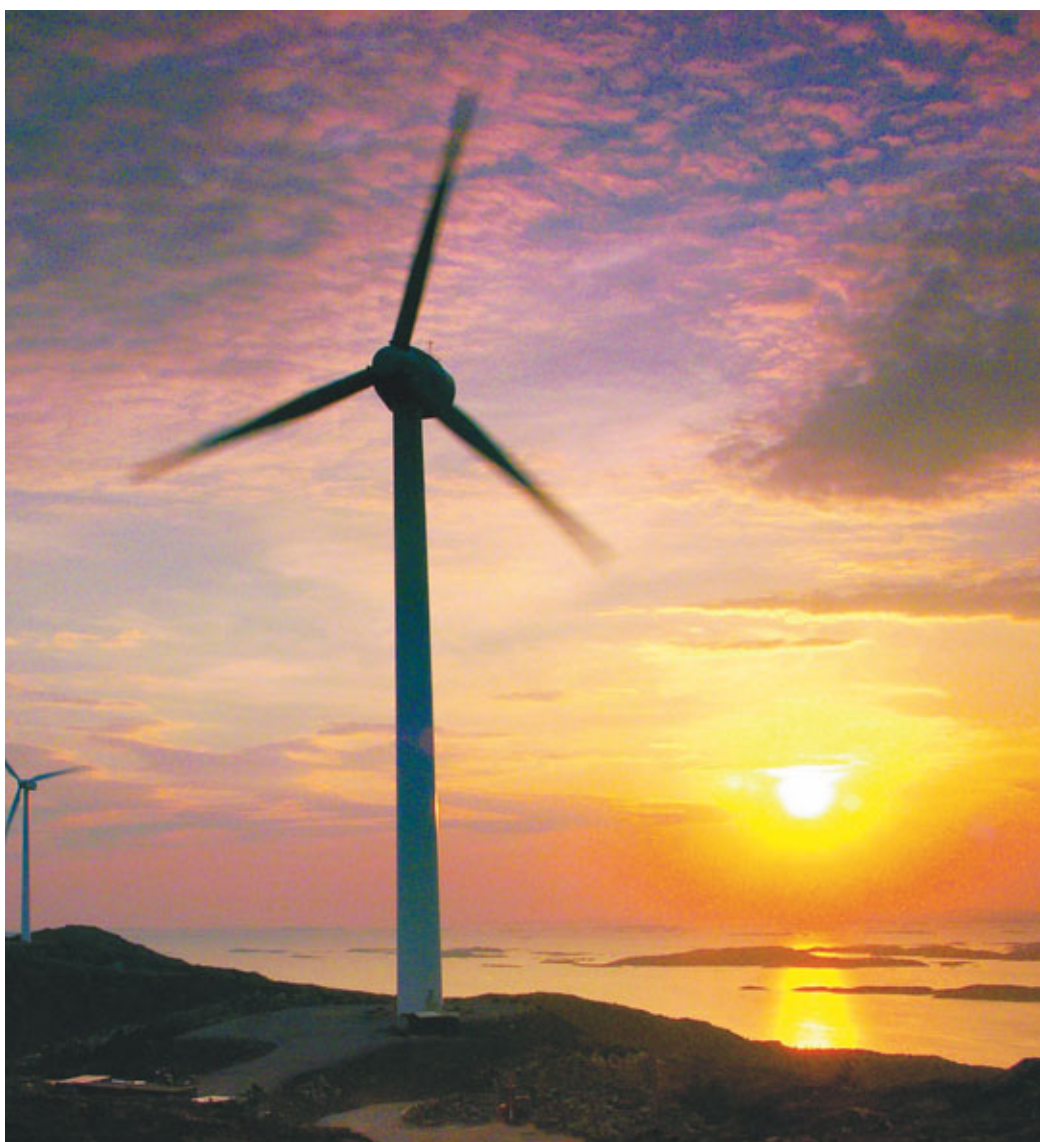
Hundhammerfjellet og Folla i kveldssol.

NVE og Reindriftsforvaltningen mener at det i enkelte tilfeller kan være aktuelt å gjøre undersøkelser for å fastslå nyttevirkningene av avbøtende tiltak fastsatt gjennom konsesjonsvilkår. Dette fordi det i enkelte tilfeller kan tenkes at virkningene av ulike tiltak er usikre. Slike undersøkelser kan enten være fastsatt som egne konsesjonsvilkår eller gjennomføres gjennom opplegg (f.eks FoU) som ikke er knyttet til den konkrete konsesjon.