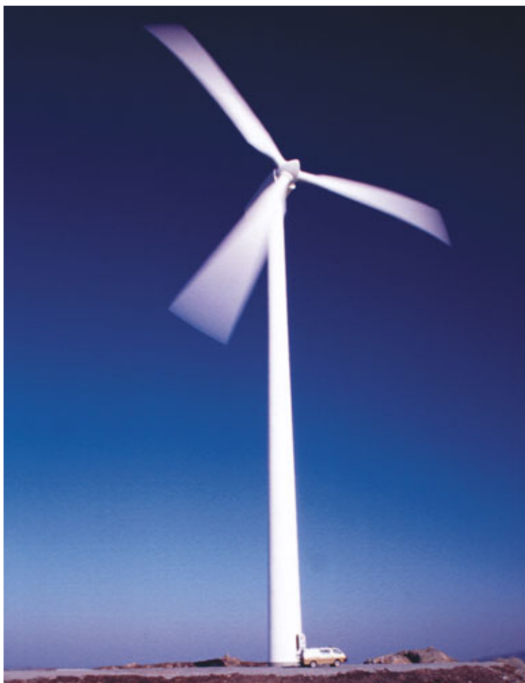
1,65 MW Vestas vindturbin på Hundhammerfjellet.

Foruten å kontakte riktige instanser til riktig tid må tiltakshaver være klar over at reineierne og representantene for reinbeitedistriktene er samiske næringsutøvere som må forholde seg til utbygger på et fremmed språk. I kontakt med reineierne må tiltakshaver legge