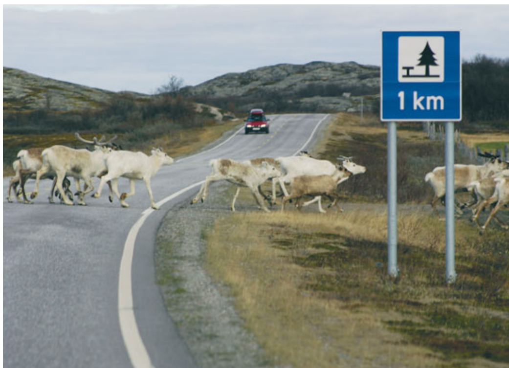
Veier er blant infrastrukturtiltakene som er med på å fragmentere reinbeitelandet.

Reindriftsutøvernes rettigheter og plikter er beskrevet i reindriftsloven kapittel III. Reindriftsretten er i § 9 definert som en bruksrett som gjelder uavhengig av grunneierforhold