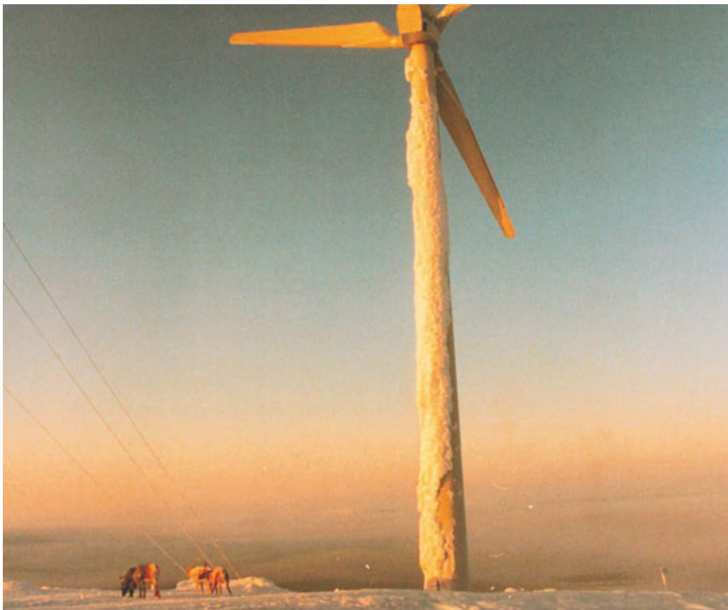
Reinsdyr nær vindturbin i Finland.

forholde seg til for tiltakshaver. Det er først og fremst siidaen som i den senere tid har fått økt betydning gjennom rettspraksis og økt politisk bevissthet. Siidaen er et begrep som brukes om reindriftens tradisjonelle arbeidsfellesskap. Siidaen består av mange enkelt-reineiere som deler på arbeidet, men der hver enkelt reineier har eiendomsrett til egne rein. Et reinbeitedistrikt kan bestå av en eller flere siidaer, og bruken til siidaene er oftest som den har vært fra gammelt av. Det betyr at de fleste siidaer gjennom alders tids bruk har etablert meget sterke bruksrettigheter i og på sine tradisjonelle områder.