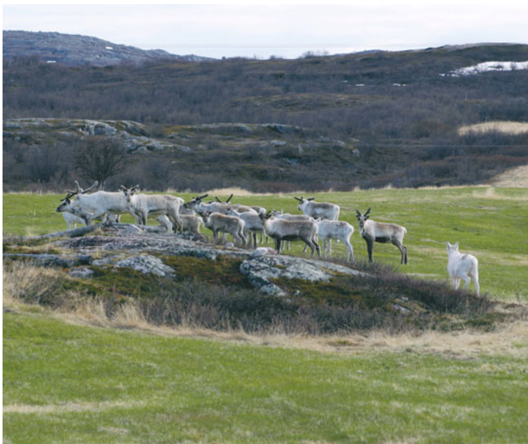
Reinen vender tilbake til sine tradisjonelle vårområder selv om områdene er tatt i bruk av andre.

Regionen består av 29 reinbeitedistrikter med over 100000 rein og noe over 300 driftsenheter (konsesjoner). Spesielt for regionen er høy reinitetthet, tørre og kontinentale vinterbeiter og lange årstidsflyttinger. Alle distriktene har vinterbeite på "fellesbeitene" inne på vidda og sommerbeite i egne distrikter på kysten. Fellesbeitene består av mange tradisjonelle siidaområder, der stort sett hver siida gjennom alders tids bruk har spesielle rettigheter til eget område selv om arealet ikke er underlagt noen formell inndeling av norske myndigheter.