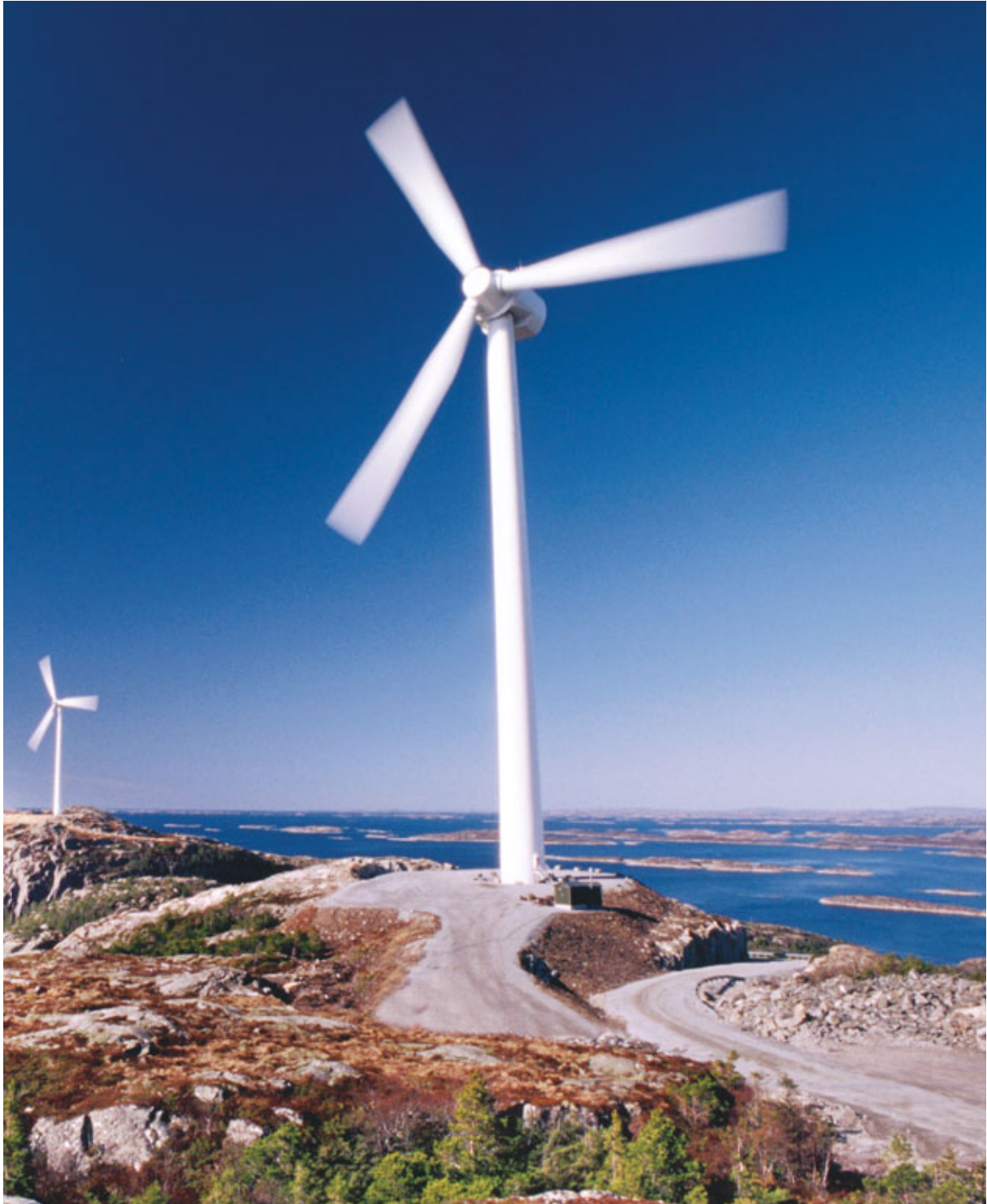
Vindmøller på Hundhammerfjellet i Nærøy kommune.